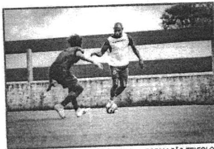
TÉCNICO SURIAN AINDA NÃO DEFINIU A FORMAÇÃO TRICOLOR PARA ENCARAR O VILA NOVA

Com treinos encerrados em São Luís, o Sampaio embarca na tarde desta quinta-feira para Goiânia-GO. A definição da equipe acontece na tarde desta sexta-feira, já com treinamento no estado de Goiás.